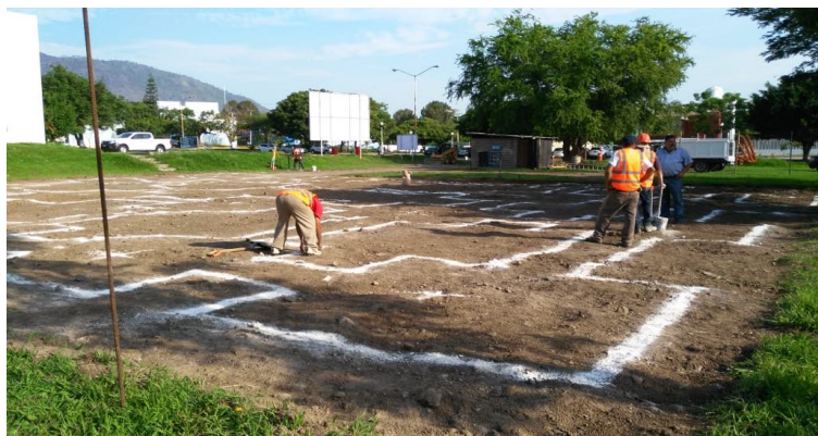
F3: Fachada posterior